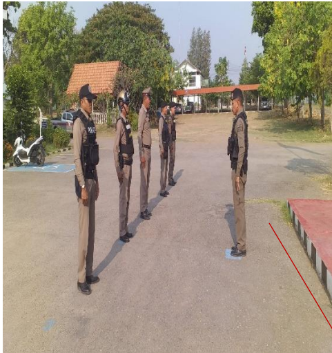
มีอุปกรณ์ใช้ในการ ปฏิบัติหน้าที่ทุกนาย

รายงานผลการดำเนินงานการประเมินความเสี่ยงต่อการรับสินบนของสถานีตำรวจภูธรกุดรัง ประจำปีงบประมาณ ๒๕๖๗ (๒)สายงานป้องกันปราบปราม